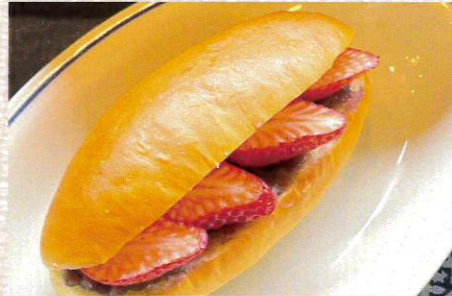
木挽町よしや「あんこ」×BAR yu-nagi 「やよいひめいちご」コッペ 594円