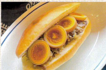
銀座吉澤 すき焼きコッペ 702円