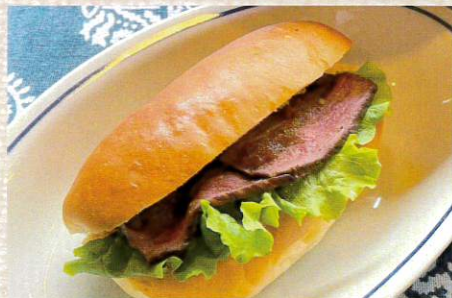
割烹中場 割烹のローストビーフコッペ 702円