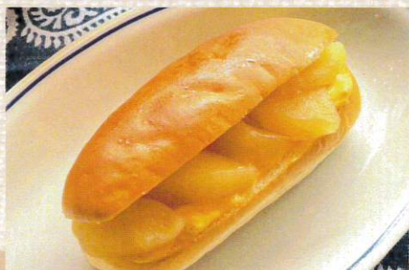
ピエス・モンテ りんごのコンポート&カスタードコッペ 648円