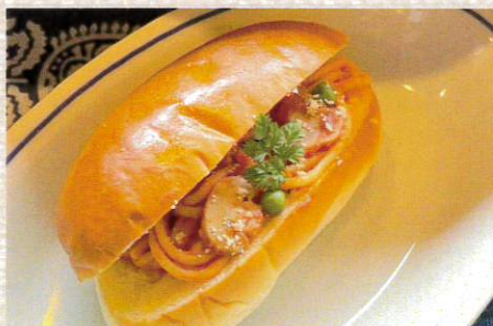
煉瓦亭 ナポリタンコッペ 594円