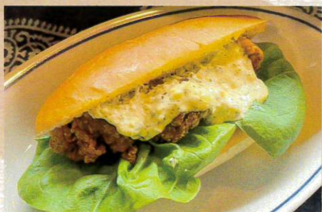
三笠会館 唐揚げコッペ 594円