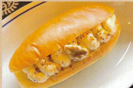
銀座ウエスト ベルガモットクリームコッペ 648円